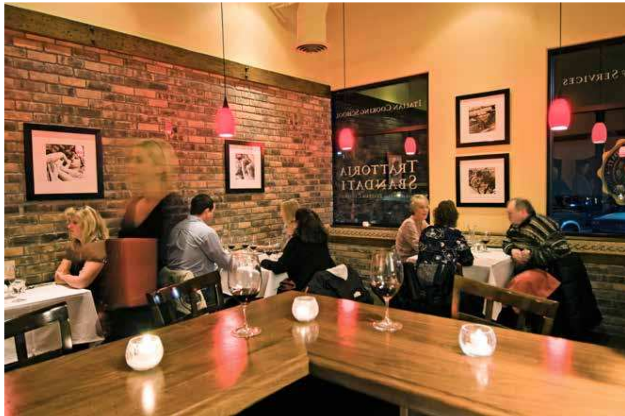
Clockwise from bottom: Paula Watts (2), Courtesy of Wanderlust Tours

Dine at Trattoria Sbandati, an intimate 36-seat restaurant showcasing authentic Tuscan cuisine.